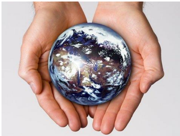
Abb 1: https://umwelt.hessen.de